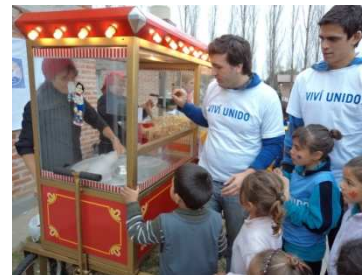
Día del Niño